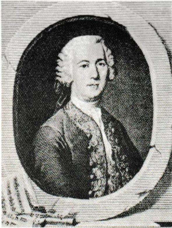
Johann Joachim Quantz

Le concerto en la majeur enregistré ici fut écrit probablement à Potsdam. Il est destiné soit à la flûte ( Wtq n° 168 ), soit au violoncelle ( Wtq n° 172 ), soit au clavier, clavecin ou piano ( Wtq n° 29 ). Sa structure en 3 parties, marque l'héritage italien de Vivaldi tandis que chaque mouvement annonce la nouvelle forme de la sonate. L'allegro initial présente quatre ritournelles des cordes entre lesquelles s'intercalent trois soli qui en dérivent directement. Le premier solo offre le caractère d'une exposition, le deuxième faisant figure de développement, le troisième rassemblant les idées des deux premiers. Le largo , en la mineur, présente aux violons et alti en sourdine, un thème récitatif chargé d'une grande intensité dramatique annonçant bien des pages romantiques. L'allegro conclut l'œuvre dans une atmosphère d'une volubilité et d'une véhémence extraordinaires tant par l'ardeur de son rythme que par le dynamisme du dialogue échangé entre le soliste et l'orchestre.