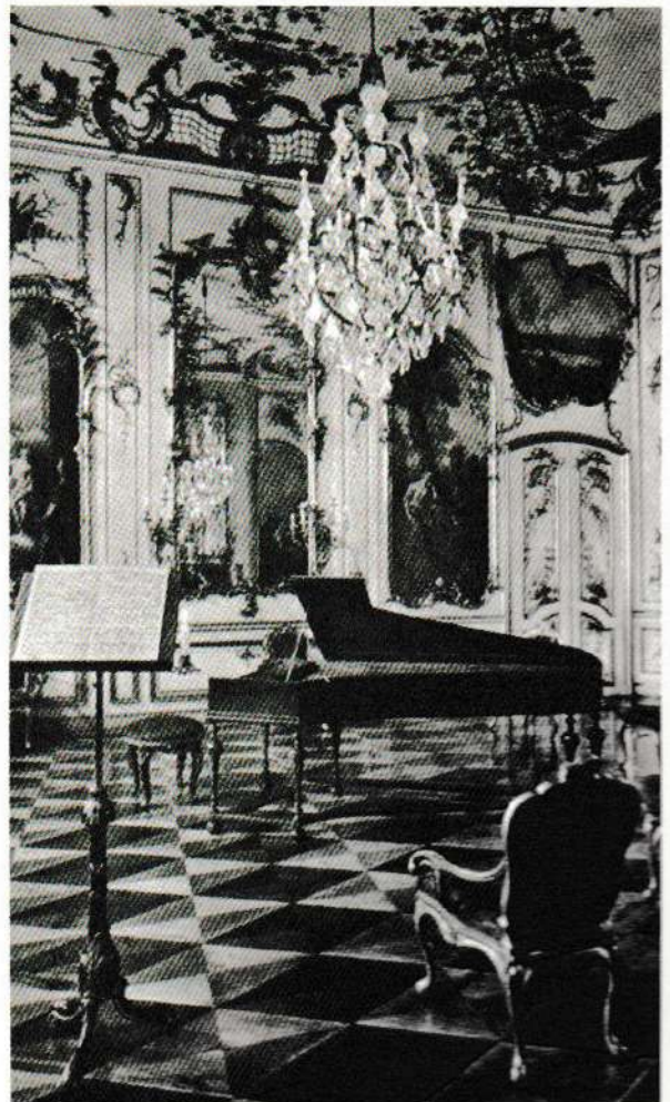
Le Salon du Château à Potsdam

Jean-Chrétien, né le 5 septembre 1735 à Leipzig, connaît une enfance beaucoup plus sombre que celle de son demi-frère Carl-Philip-Emmanuel. Il ne connaît pas comme lui les fameux concerts familiaux qui faisaient la joie des enfants aînés du cantor. A la mort de son père, il a 15 ans et reçoit pour tout héritage trois clavecins et 38 thalers. C'est précisément Carl-Philip qui le reçoit à Berlin pour achever son éducation. Très tôt, Jean-Chrétien devient un virtuose du clavecin. Mais il fréquente aussi l'opéra alors « gratuit pour toute personne décentement vêtue », se familiarise avec le style italien des représentations pour lequel il nourrit une profonde admiration, au point qu'il manifeste le désir de se rendre en Italie. Aussi emboîte-t-il le pas d'une chanteuse italienne qui retourne dans son pays, rompant définitivement avec les membres de la famille Bach.