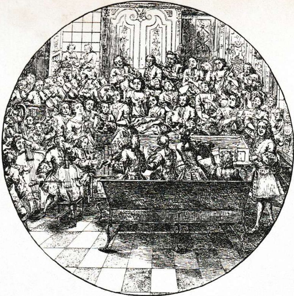
G. F. Haendel et ses musiciens (Londres, vers 1745)

"If e'er Arion's music calm'd the floods, And Orpheus ever drew the dancing woods; Why do not British trees and forest throng To hear the sweeter notes of Handel's song?"