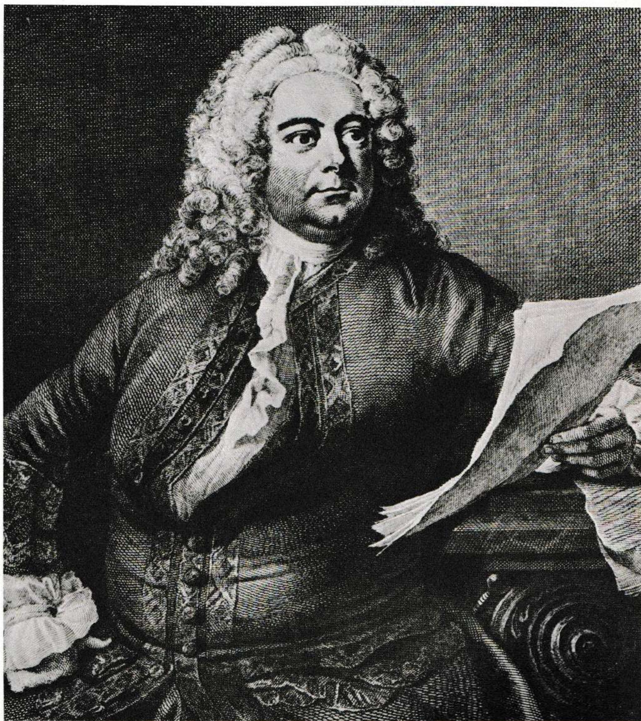
Georges Frédéric Haendel (1685-1759), gravé d'après le portrait de sir Thomas Hudson, 1749.