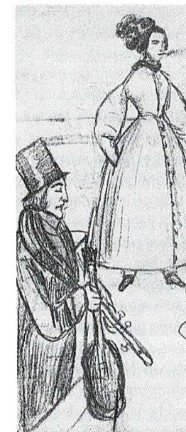
George Sand en 1833