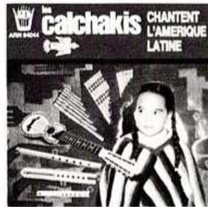
COMPACT N° 5 ARN 64044