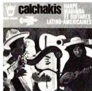
COMPACT N° 4 ARN 64032