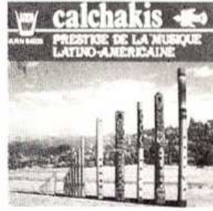
COMPACT N° 3 ARN 64025