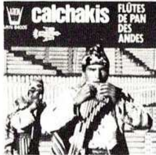
COMPACT N° 2 ARN 64005