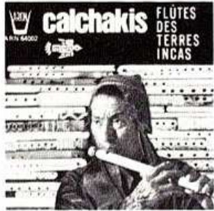
COMPACT N° 1 ARN 64002