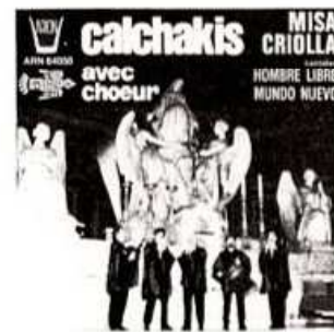
COMPACT N° 6 ARN 64050