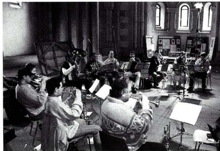
LES CUIVRES FRANÇAIS