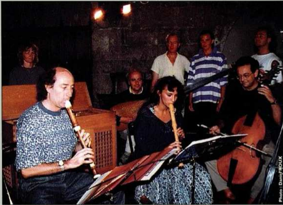
ENSEMBLE MUSICA ANTIQUA

Morceaux choisis Favourites Morceaux choisis