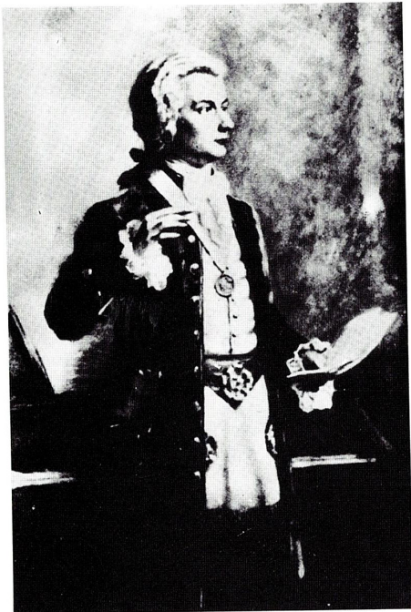
MOZART revêtu des décors maçonniques au grade de Maître du rite de la Stricte Observance